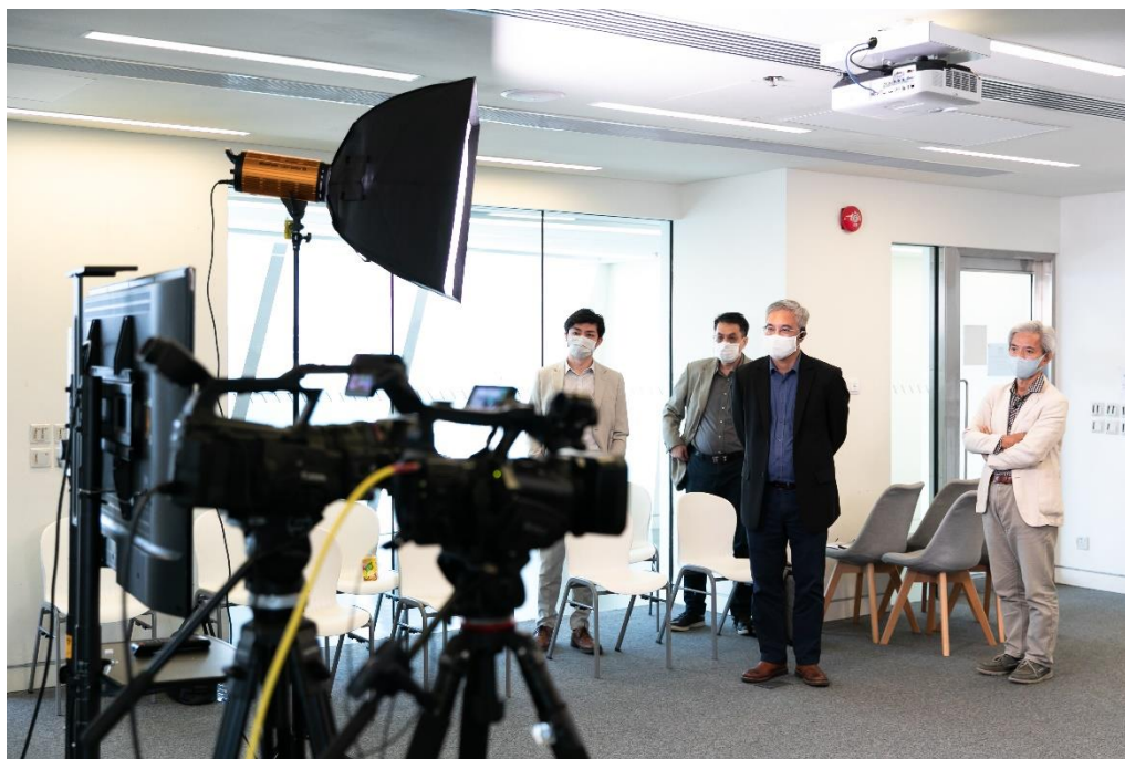
凌先生、現場講者及主持用心聆聽線上講者的分享

社會創新區域論壇 2020 專題研討三已圓滿結束，接下來在 11 月 20 日（星期五）下午 14：30 將會進行專題研討 4「社會創新的區域協同與發展」，活動透過線上直播的方式舉行，歡迎報名參加！